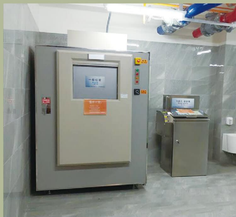
進階版 - 自動門