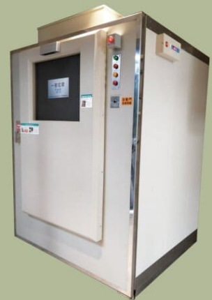
進階版 - 自動門